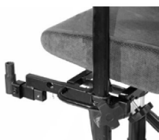
+Adapter till Cross benstöd