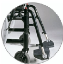
Cross benstöd och fotplatta