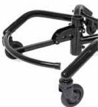
Fotring 1/4 uppfällbar