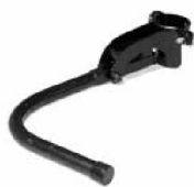
Fotring 1/8 uppfällbar