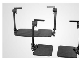
Benstöd Medic delad och hel fotplatta