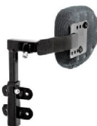
Bålstöd rak båge