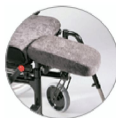
Amputationsbenstöd Cross. OBS Behöver kompletteras med adapter benstöd Cross