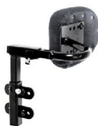
Bålstöd svängd båge