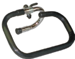
19098 Jörn/Line 19088 Rasmus 2-delat styre