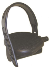
22340 Balanspedal med justerbar rem, par