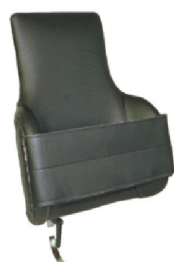
19095 Jörn 18916 Line 18942 Rasmus Kroppsstöd högt m. fäste