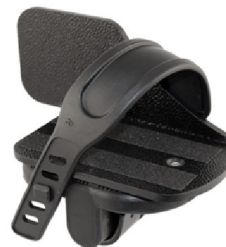
42365/42364 Balanserad pedal med sidostöd hö/vä