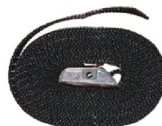
13138 50 cm 17397 100 cm Fotrem