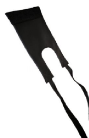
19096 Jörn/Line 18941 Rasmus Väst till högt kroppsstöd