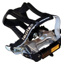
24623 Pedal med tåclips, par Strl M