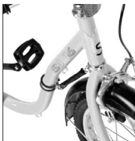
23350 16"-20" 42911 24" Styrutslagsbegränsare