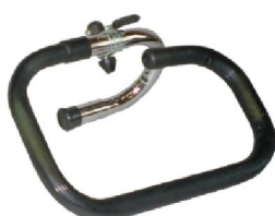
19098 Jörn/Line 19088 Rasmus 2-delat styre