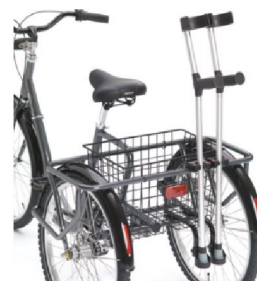
23233 24" Kryckkäppshållare m. korgfäste