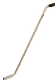
31106 16"-20" 34002 24" Påskjutsstång