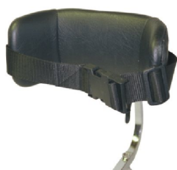
19094 Jörn 17930 Line 19086 Rasmus Kroppsstöd lågt m. fäste