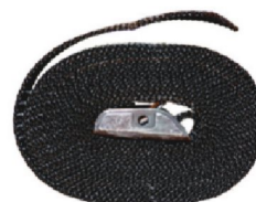
13138 50 cm 17397 100 cm Fotrem