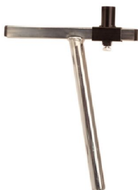
32886 16" 32887 24" Sadelstolpe till limpsadel