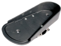
22335/22336 16"-20" 22337/22338 24" Balanserad fotplatta hö/vä (Kompletteras med 2 st fotremmar/fotplatta)