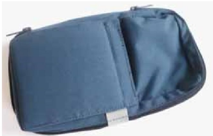
23943 Pumpväska flergångs 50/100 ml