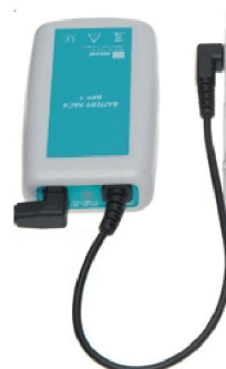
41147 Externt laddningsbart batteri till Rythmic-pumpar