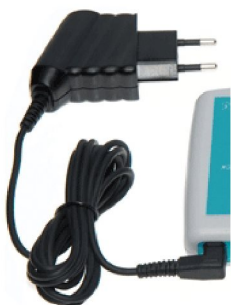
41148 Nätadapter till Rythmic-pumpar