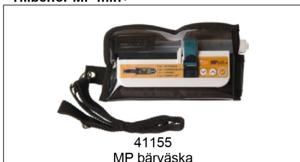
41155 MP bärväska