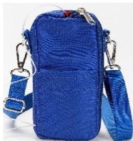
44531 Pumpväska till SO CONNECT+/PAR (Blå mjuk)