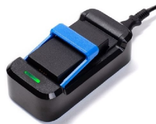
45522 Batteriladdare till SO CONNECT+/PAR inkl. elkabel

Denna pumpväska ingår i SO Connect+ startkit (EJ PAR)