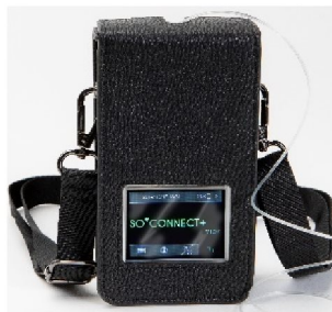
44610 Pumpväska till SO Connect+/PAR (svart läderimitation)

Denna pumpväska ingår i SO Connect+ startkit (EJ PAR)