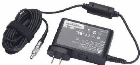
40190 Wall-mount AC adapter