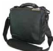
36390 Axel-/handväska till Inogen One G2