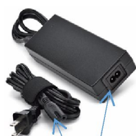
40549 Nätkabel 230V för SimplyGo Mini 42266 Nätkabel/adapter