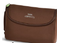
40670 SimplyGo Mini tillbehörsväska, brun