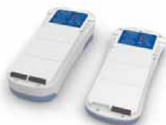
36395 Batteri 12-cell till Inogen One G2 36394 Batteri 24-cell till Inogen One G2