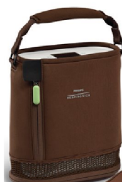
40553 Väska inkl. bärrem SimplyGo Mini