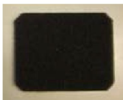
40546 Grovfilter EverFlo (flergångs)