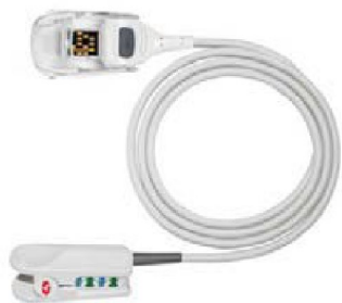
34066 Fingerprob/sensor RD SET- DCIP barn Vikt 10-50 kg