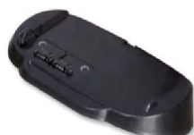
40556 SimplyGo Mini extern batteriladdare