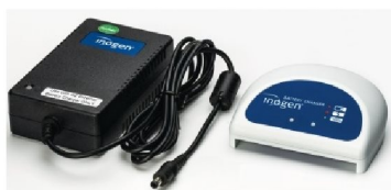
37782 Bordsladdare till Inogen One G2