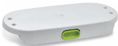
40550 SimplyGo Mini standard Litium Ion- batteri 40551 SimplyGo Mini stort Litium Ion-batteri