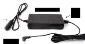
40134 DC-laddare 12V till Inogen One G2