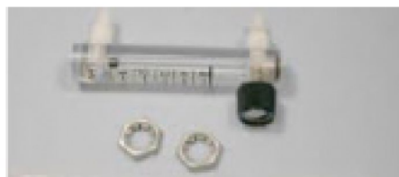
40548 Lågflödesmätare EverFlo 0,1 - 1 LPM