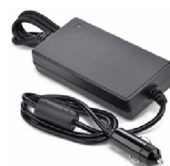
40552 Kabel SimplyGo Mini 12 V