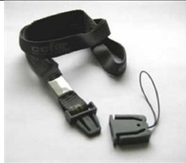
26353 Halsband o bältesclips