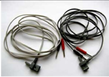
26322 Cable 2st/fp