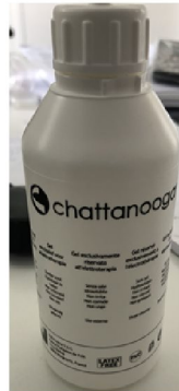
10087 Chattanooga TENS gel 250 ml