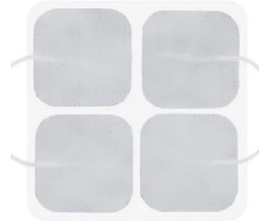
42725 Hudelektroder 50x50 4 pack