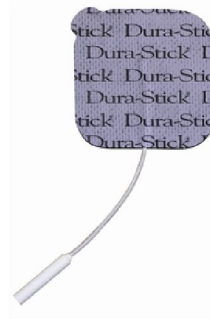
25466 Dura Stick Plus 5x5 cm fyrkant 4 st/fp