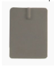
10084 Electrode sil/carbon 6x8 cm