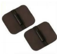
42729 Kolgummielektrod 60x40 2 pack