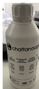
10087 Chattanooga TENS gel 250 ml