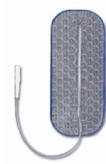
34325 Dura Stick Premium 4x9 cm rekt, Blå