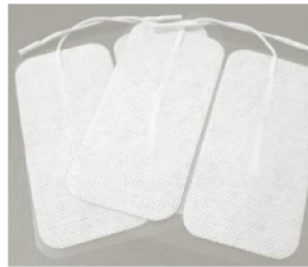
42723 Hudelektroder 100x50 4pack