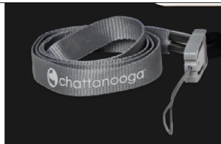
47385 Cefar TENS necklace