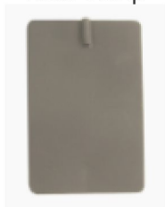
47567 Electrode sil/carbon 8x12 cm