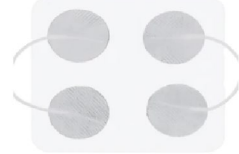
42724 Hudelektroder 30 mm rund 4 pack