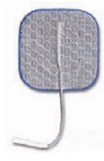
27944 Dura Stick Premium 5x5 cm fyrkant, Blå