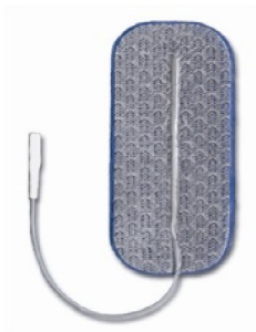
Tilläffligt stoppad hos leveratör! 34325 Dura Stick Premium 4x9 cm rekt, Blå