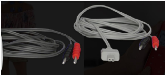
47383 Cefar TENS cables 2pcs