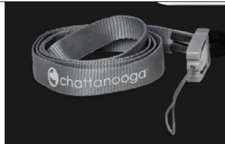
47385 Cefar TENS necklace