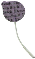
25465 Dura Stick Plus 3,2 cm rund 4 st/fp