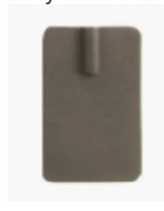
10083 Electrode sil/carbon 4x6 cm