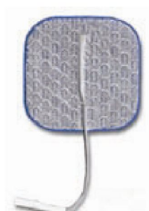
Tilläffligt stoppad hos leveratör! 27944 Dura Stick Premium 5x5 cm fyrkant, Blå