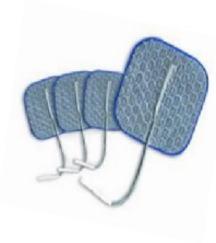
42727 Hudelektroder PALS för sensitiv hud 50x50 4pack