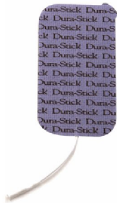
25467 Dura Stick Plus 5x9 cm rekt 4 st/fp