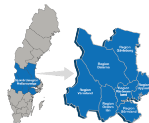
En kartbild över regionerna som ingår i Sjukvårdsregion Mellansverige.

Du kan ta del av granskningsrapporten och svaret i sin helhet på Revisionens hemsida .