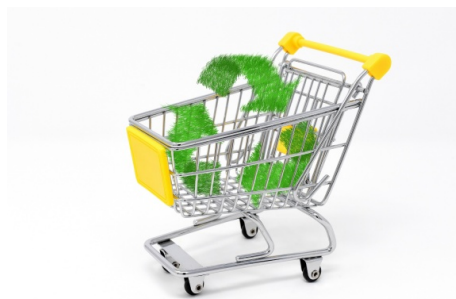
En illustration av en kundvagn med gröna pilar i varukorgen för hållbara inköp.

Granskningen visar att inköpsverksamheten idag inte hanterar alla regionens direktupphandlingar. Att inköpsverksamheten används vid inköp av varor och tjänster kan anses vara effektivt då kunskap om upphandlingslagstiftningen finns samlad där.