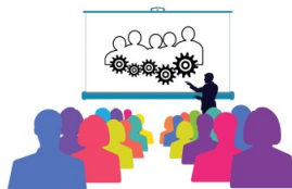
En illustration av människor som tar del av en presentation av en föreläsare.

Detta omfattar dokumentationen av både själva samtalet men också av karriärvägar för aktuella yrkesgrupper.