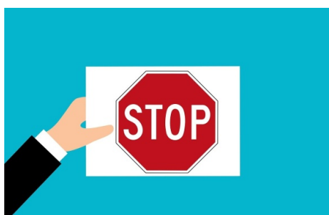
En illustration av en hand som håller ett papper med en stoppskylt på.

Du kan ta del av granskningsrapporten i sin helhet på Revisionens hemsida .