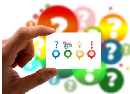
En illustration av en hand som håller ett litet kort med ett frågetecken, kugghjul, glödlampa och utropstecken. Symboliskt, en fråga som får ett svar.

Bedömningen grundar sig på att det idag saknas politiskt beslutade styrande dokument för detta. Detta gäller även för fortsatt samverkan i Sjukvårdsregionen Mellansverige, då regionstyrelsen inte ännu behandlat den aktivitetsplan som beslutades i december 2024 i Samverkansnämnden.