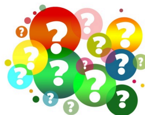
En illustration med frågetecken i olika färgade bubblor.

Frågorna handlar om fullmäktiges syn på revisionsarbetet och Revisionens kommunikation/information under mandatperioden. Det är femte gången vi genomför denna typ av enkät. Senast var år 2022 och då genomfördes enkäten vid det sista fullmäktigesammanträdet för mandatperioden.