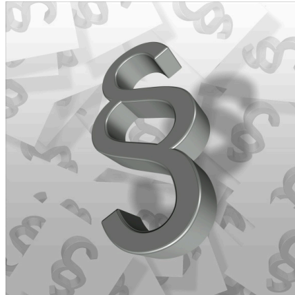
En illustration av ett tredimensionellt paragraftecken

Svaret som kommit på Revisionens hemsida .