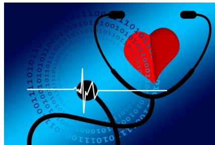
En illustration av ett hjärta, ett stetoskop samt hjärtfrekvens så som det synliggörs på ett EKG samt fyra cirklar med ettor och nollor (datakod).

Du kan ta del av granskningsrapporten och svaret i sin helhet på Revisionens hemsida .