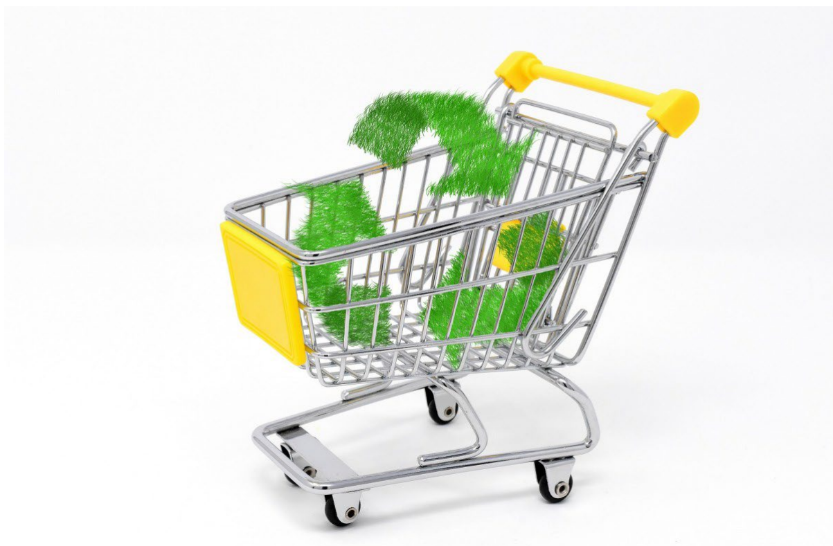
En kundvagn som illustrerar hållbara inköp.