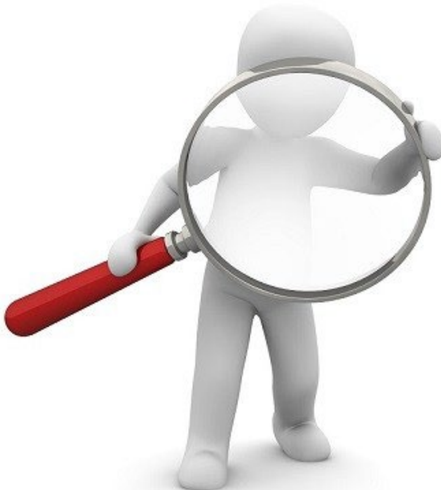
Illustration av en person med förstoringsglas som granskar.

Du kan ta del av hela rapporten på Revisionens hemsida .