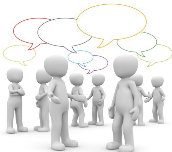
Tecknade personer som pratar med varandra illustrerat med pratbubblor.

Granskningsrapporten och svaret i sin helhet finns att ta del av på Revisionens hemsida .