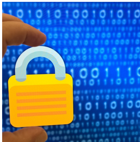
En illustration med en hand som håller i ett låst hänglås framför ettor och nollor på en dataskärm.

Regionen har vidtagit åtgärder för att öka kännedom om regelverket men vi bedömer att fortsatta åtgärder behövs.