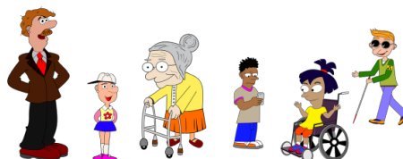
En illustration av människor i olika åldrar med behov av olika hjälpmedel.

Rapporten lyfter ett antal områden som kan utvecklas för att ytterligare utveckla den ekonomiska och verksamhetsmässiga hanteringen; formalisering av hantering av kundlager, arbetsbeskrivningar och rutiner för hur lageransvariga ska agera vid eventuell större avvikelse vid inventering.