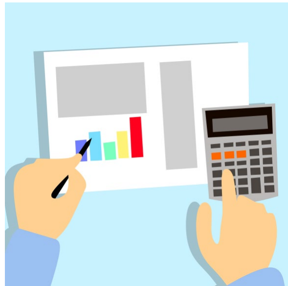
En illustration av två händer. Den ena håller en penna över ett papper med ett stapeldiagram. Den andra använder en miniräknare.

Du kan ta del av granskningsrapporten och svaret i sin helhet på Revisionens hemsida .