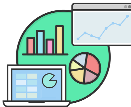
En illustration av en dataskärm, cirkeldiagram och kurvor för uppföljning.

Den fördjupad granskningen gjordes med fokus på den prioriterade inriktningen