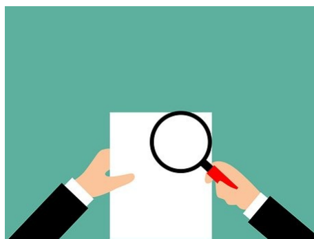
Två händer som håller ett vitt papper. Den högra handen håller också i ett förstoringsglas framför pappret.