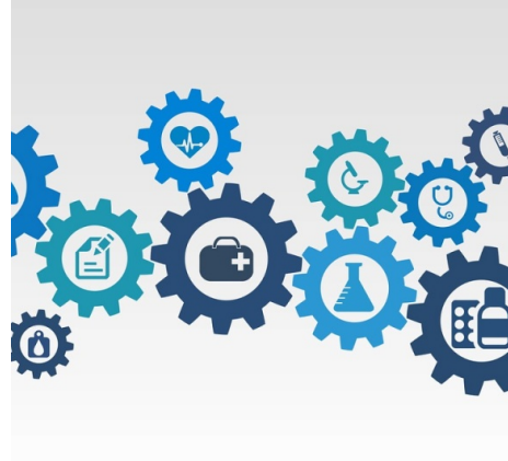
En illustration av vårdkedjor via kugghjul som innehåller olika typer av vårdmoment.

Information om befintligt uppföljningsverktyg behöver spridas i verksamheten och indikatorer för ledtider i remissflödet tas fram och etableras i ordinarie uppföljningsprocess.