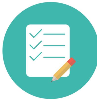
En illustration av en checklista som är avbockad och en penna.

Den sammanfattande bedömningen, efter genomförd uppföljning, är att följsamheten till lämnade rekommendationer i huvudsak är god.