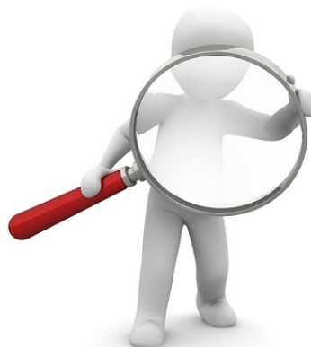
En tecknad figur av en människa som håller i ett stort förstoringsglas.