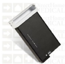
36384 Batteri SimplyGo Li Ion