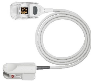
42517 Fingerprob/sensor RD SET- DCI vuxen Vikt >30 kg