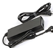
36385 Strömadapter SimplyGo