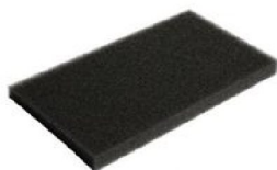
30716 Luftfilter/Grovfilter till Perfect O2 (flergångs)