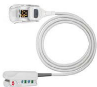
34066 Fingerprob/sensor RD SET- DCIP barn Vikt 10-50 kg