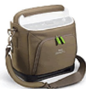
36383 Bärväska SimplyGo