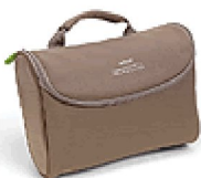
36381 Tillbehörsväska SimplyGo