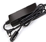
36382 Likströmskabel SimplyGo 12Vr