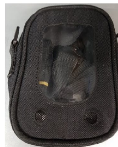
38089 Bärväska till Bitmos sat 801+