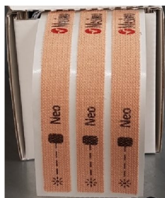
33571 Ersättningstejp Masimo till RD sensor 4003