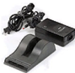
37728 Bordladdare extern (passar både Simply Go och EverGo)