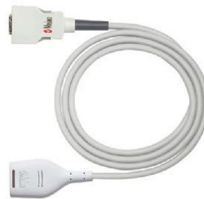
38441 Mellankabel Masimo RD anslutning MD14 360 cm VIT kontakt